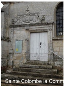
Sainte Colombe la Commanderie