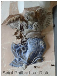
Saint Philbert sur Risle