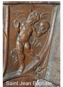
Saint Jean Baptiste