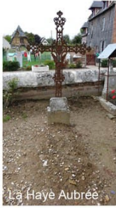
La Haye Aubrée