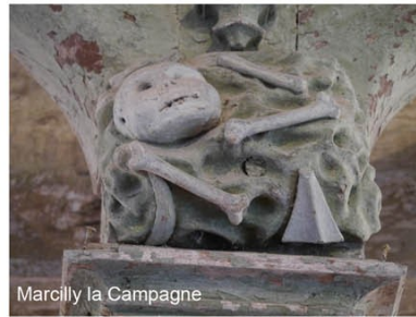
Marcilly la Campagne