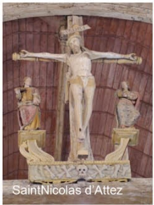
Saint Nicolas d'Attez