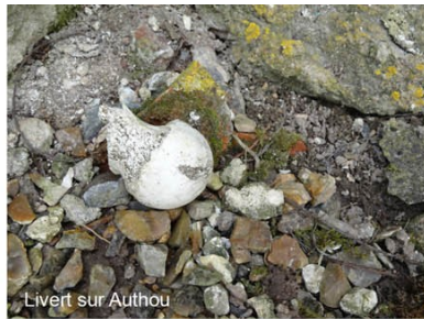
Livert sur Authou