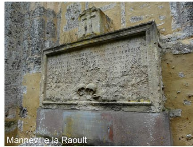
Manneville la Raoult