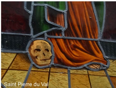
Saint Pierre du Val