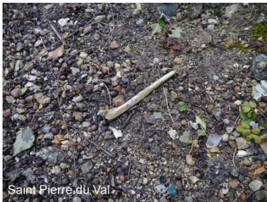
Saint Pierre du Val